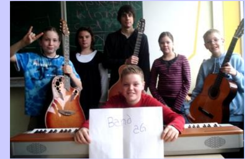
Rockband - AG